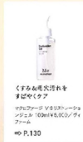
くすむ&毛穴汚れをすばやくケア

マクロファージ V4リフトアップジェル 100ml ¥5,000 / ヴィファーム